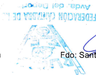
Fdo: Santiago Moroso Fernández